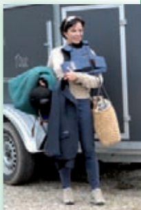
Voll bepackte Turnier-Mama