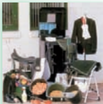
Beim Einpacken kommt allerhand zusammen.